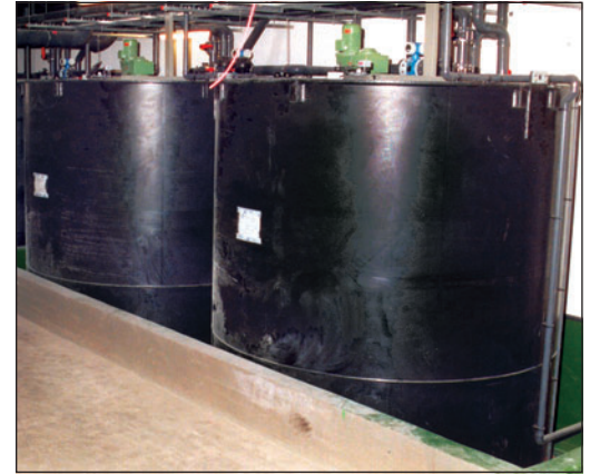
Ein wichtiger Punkt in jedem Schutzkonzept: Für den Fall einer Leckage müssen Behälter und Anlagen über Auffangeinrichtungen verfügen.

Die erste Grundvoraussetzung beim Umgang mit Wasser gefährdenden Stoffen ist eine dichte Anlage, um das Austreten von Flüssigkeiten zu verhindern (1. Barriere). Im Falle einer doch eintretenden Leckage muss über eine Auffangeinrichtung sichergestellt sein, dass ausgetretene Flüssigkeiten kontrolliert aufgefangen und zurückgehalten werden (2. Barriere). Neben