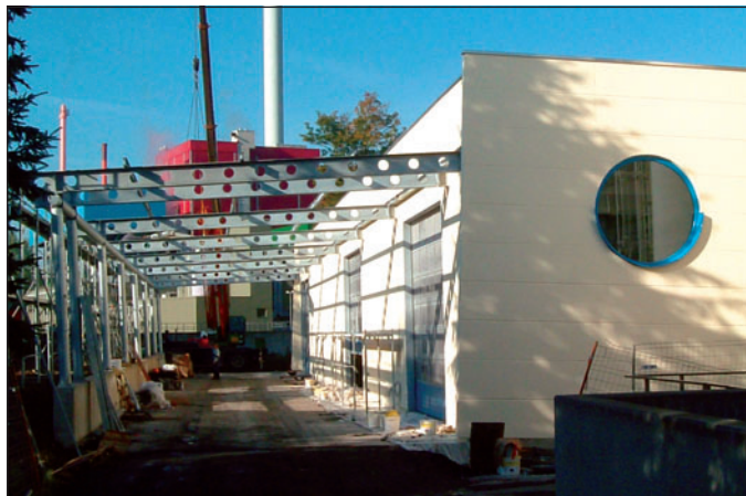
Ein Jahr lang dominierte das Baugeschehen die Szenerie auf dem Gelände der ZEA. In diesem Monat fällt endlich der Startschuss für den Betrieb der ersten Verwertungsmodule.

tingsquote möglich. Chemische, physikalische und biologische Abfallbehandlung bilden in Iserlohn ein Gesamtsystem, das durch eine mehrstufige Abwassernachbehandlung ergänzt wird. Problematische komplexbildnerhaltige Abfälle wie Chemisch Nickel oder Legierungsbäder werden beispielsweise in Ozonreaktoren behandelt. Die o. g. „Problemstoffe“ werden durch Ozon zerstört bzw. in fällbare Verbindungen umgewan-