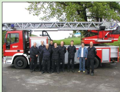
Gruppenfoto mit Drehleiter