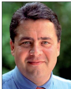
Umweltminister Sigmar Gabriel musste das Scheitern des UGB einräumen.

Das Bundesumweltministerium hat auf die Entwicklung inzwischen reagiert und den Entwurf eines neuen Wasserhaushaltsgesetzes auf den Weg in das Bundeskabinett gebracht. Von dort aus soll es ohne vorherige Öffentlichkeitsbeteiligung in den Bundestag eingebracht werden. Der Text dieses neuen Wasserhaushaltsgesetzes stimmt in weiten Teilen mit dem des Entwurfes des „UGB II: Wasserwirtschaft“ überein und ergänzt ihn lediglich um einige bislang für das UGB I vorgesehene Regelungen (z. B. über Gewässerschutzbeauftragte). Da der Text dieses dergestalt modifizierten UGB II keine Überraschungen enthält, dürfte mit einer Verabschiedung noch in dieser Legislaturperiode zu rechnen sein. Sobald dies der Fall ist, werden wir Ihnen an dieser Stelle das neue Bundeswasserwirtschaftsrecht („Wasserhaushaltsgesetz“) vorstellen. In der Folge werden viele landeswasserrechtliche Regelungen gegenstandslos werden. Auch darüber werden wir Sie informieren.